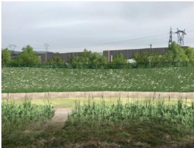
APRES - Perspective depuis Bry, du 1er étage