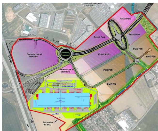
Illustration 2: Implantation du site Linkcity sur la ZAC du Chemin Herbu

Le site est actuellement constitué de terrains agricoles, libre de construction et les plus proches habitations sont situées en bordure sud du site, au sein du hameau de Bry. L'aménagement de la ZAC prévoit la mise en place d'un merlon planté en bordure sud du site, afin de protéger les habitants du hameau de Bry des nuisances sonores et visuelles du site.