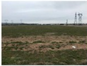
AVANT - Photo depuis Bry, du 1er étage