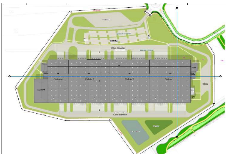
Illustration 3: Plan d'ensemble du site et du bâtiment projeté