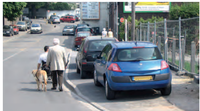
Stationnement sur trottoir, obligeant les personnes à mobilité réduite à se déplacer sur la voirie

Un bilan est réalisé tous les 5 ans à partir du fichier BAAC (base des accidents corporels de la police) et de l'outil informatique CONCERTO. L'objectif est de définir des secteurs où le risque d'accident pour une traversée piétonne est fort en raison d'un certain nombre de facteurs (largeur des voies, stationnement illicite, aménagement de bus non sécurisé et grand âge).