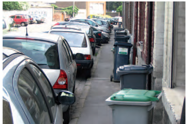
Encombrement du trottoir par les poubelles