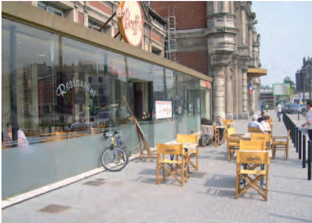
Terrasse de restaurant occupant tout l'espace piéton

Pour répondre à cette attente, un partenariat s'est établi entre le Certu, le CETE Nord-Picardie, le Collectif Handicap Accessibilité pour Tous (CHAT), la DDE du Nord (arrondissement de Valenciennes) et l'Ecole Nationale des Techniciens de l'Équipement (ENTE) pour définir une méthode pour réaliser ces nouveaux plans de mise en accessibilité, mettre au point des outils pour diagnostiquer l'accessibilité de la voirie aux PMR et ensuite intégrer les PAV dans les diagnostics du PDU voire du SCoT et même dans le PADD du PLU.